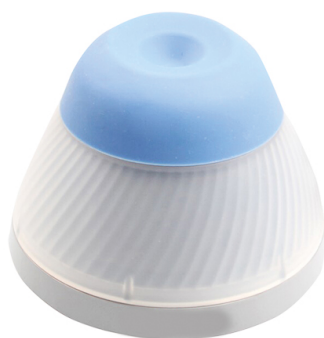
FOTO DEL PRODOTTO